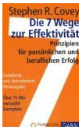
Die 7 Wege zur Effektivität

Hier nochmal die Bücher, die für mich so schwerverdaulich sind: