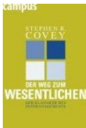
Der Weg zum Wesentlichen